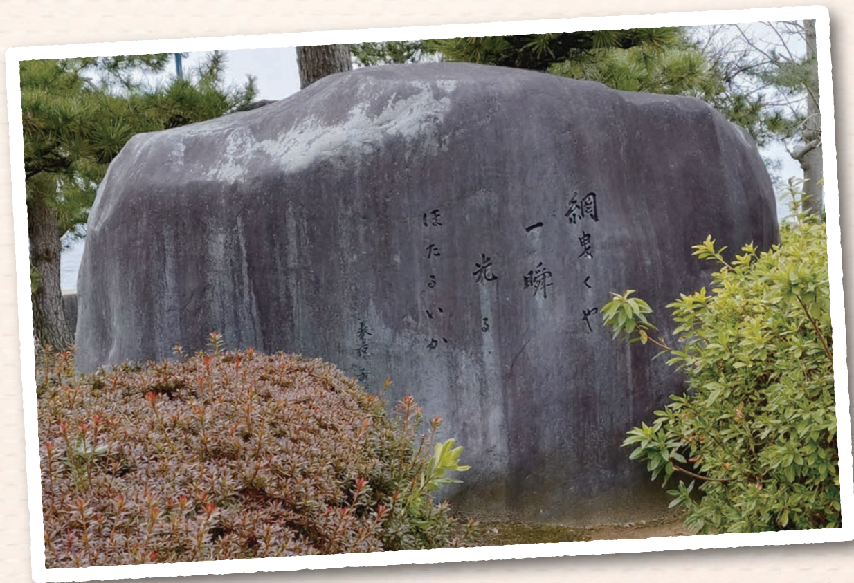
はまなす公園の石碑